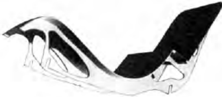
Abb. 125. Der Sitz nach Abb. 124.